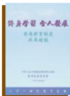
《終身學習、全人發展： 香港教育制度改革建議》 教育統籌委員會 2000年9月