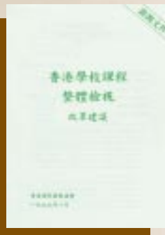
《香港學校課程整體檢視》 改革建議