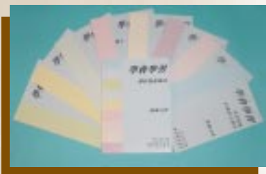
《學會學習—課程發展路向》 諮詢文件