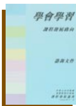
《學會學習—課程發展路向》 諮詢文件 課程發展議會 2000年11月

本報告《學會學習—課程發展路向》旨在定出在2001至2011年期間香港課程發展的大方向，並就2001-02至2005-06年的推行工作提出建議。這些課程發展的大方向及推行的建議，與2000年9月教育統籌委員會發表的《終身學習，全人發展—香港教育制度改革建議》中所提出的願景及整體教育目標互相配合。課程發展議會已考慮公眾對《學會學習—課程發展路向》諮詢文件（2000年11月）的回應、香港的教育政策、本地學校的經驗及研究，並參考其他國家課程發展的經驗。2006-07至2010-11年的推行計畫將會參考2001-02至2005-06年的檢討報告，於適當時候制訂。最終的目標是爲了提高香港教育的水平及學生的學習水平。