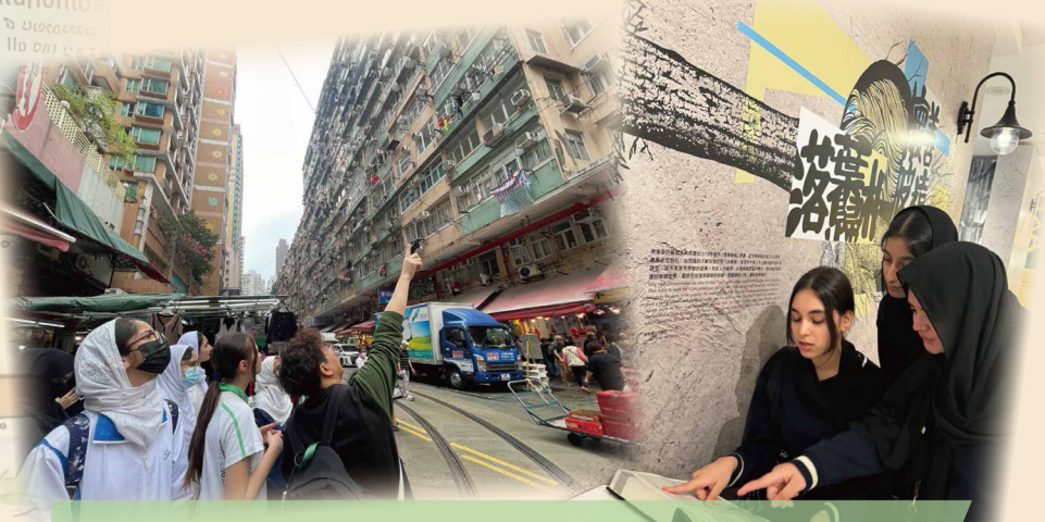
舉辦社區考察、文化體驗等沉浸 活動，聯繫學生的文化背景，培 養欣賞和尊重的態度