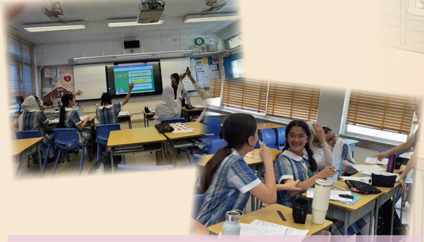
模擬真實情境的交際互動任務， 增強語文運用的信心和流暢度