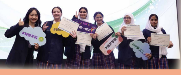
參加教育局「非華語中學生文 化對話短片拍攝比賽」，展示 和應用語文和文化學習所得