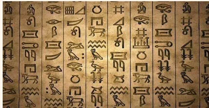
古埃及象形文字（距今約5100年）