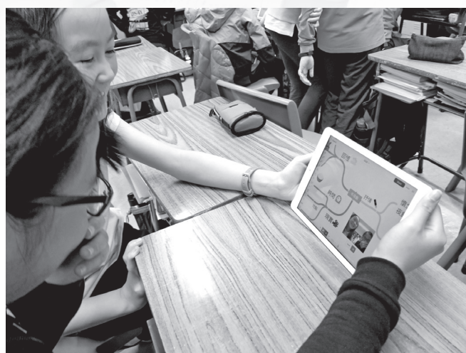
學生以小組合作學習。