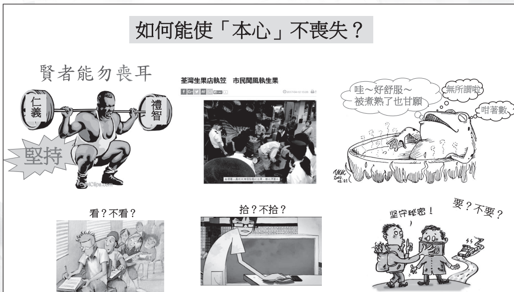
圖二：以生活化議題應用篇章所學（《魚我所欲也章》）

例如學習《魚我所欲也》一文，「捨生取義」對學生來說也許太遙遠，教師會關注篇章另一重點「君子能勿喪耳」和「保持善端，勿失本心」，這亦是重要的學習課題，意義重大。教師借助剛發生的一則小新聞——荳灣一間生果店店主失蹤，附近居民趁食環署職員前來清理前，紛紛擅取生果，這則新聞誘發網上支持和反對的熱烈討論。教師讓學生投入情境，就「你若在現場，會否加入撿生果行列？」讓學生選擇並表達理由，教師又以幾個生活示例，包括大學迎新行為（由色情口號，到三級遊戲，再到男生宿舍的性暴力欺凌）；營商手法（由小販把貨物魚目混珠，欺騙顧客，到黑店以「兩」當「斤」強迫購買），讓學生歸納共同點，最後談到「溫水煮蛙」的道理。教師讓學生從不同角度分析行為的漣漪效應，再思考和討論擅取生果與「保持本心」、「溫水煮蛙」的關係，通過表達和討論讓學生建構自己的識見和價值看法（圖二）。最後教師讓學生再次選擇「你會否加入撿生果行列？」，從而了解學生在探討過程中的領悟與思想的變化。