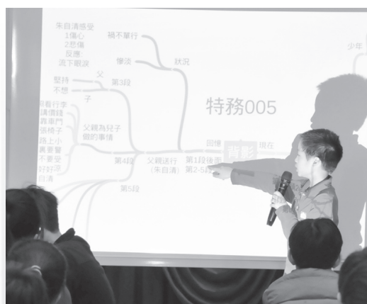
學生講解他們在解讀《背影》一文時的心智繪圖。