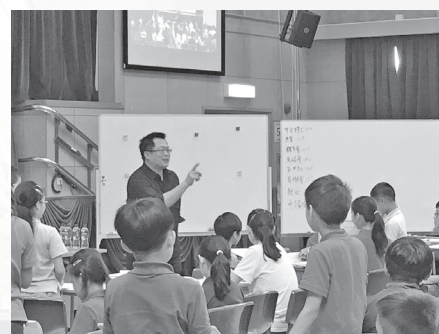
王政忠老師上「MAPS」示範課。

為了讓教師成為能自我發展、自我完善的專業團隊，學校在近年分別邀請了不同的語文教學專家到學校主講講座和上示範課，拓寬教師視野，提升專業素養。這些不同的專家學者所關注的，都是當前教育改革所面對的熱點，如「學思達」的翻轉教學模式、王政忠老師的「MAPS」教學法、黃國珍老師講閱讀素養、李崇建老師談對話的力量。學校引進這些不同類型的專業發展活動，能拓寬教師的眼界，並讓教師對新的教學思維和教學策略有直觀而真切的了解，也引起了大家見賢思齊，躍躍欲試的衝動。