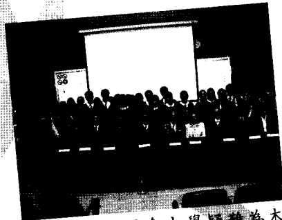
許校長擔任浸會大學疑難為本疑難為本專題研習報告比賽的評判。