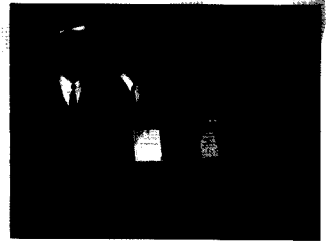
同學們表現出自信心。