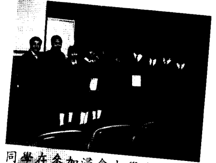
同學在參加浸會大學舉辦的疑難為本專題研習報告比賽後得優秀解難銀獎及優秀解難銅獎。