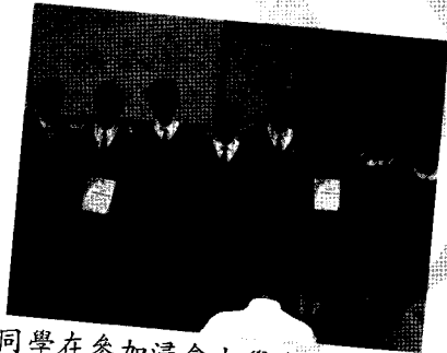
同學在參加浸會大學舉辦的疑難為本專題研習報告比賽後得到優秀解難銀獎及優秀解難銅獎。