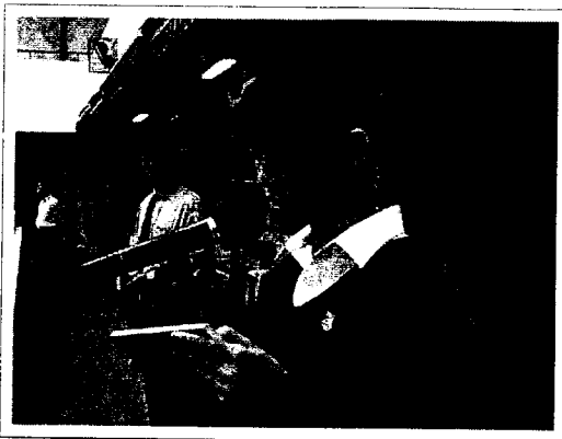
6Bs' Morning Assembly Sharing at 15/10/2004.

‘.....Actually whatever type you are, being a students, we need to have a positive attitude towards learning as it is something life-longed.....’