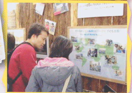
參觀者對香港同學們的環保活動很有興趣。