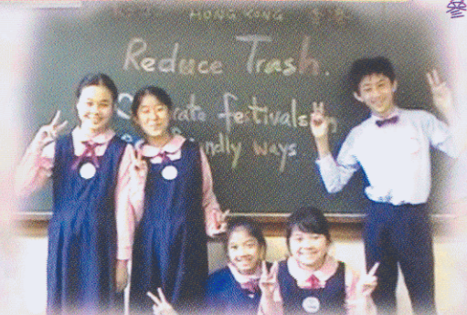
浸信會天虹小學的環保短片。