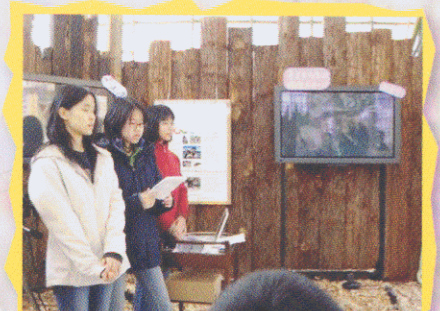
世界各地孩子的環保短片，在 Children's Global Information Station 內輪流播放。