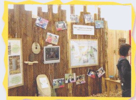
Children's Global Information Station 內展示不同地區孩子的環保活動。