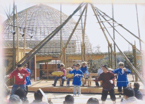
來自阿拉斯加的同學穿上原住民服裝，表演傳統捕魚舞。