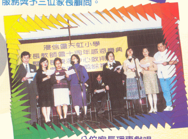
八位家長理事獻唱