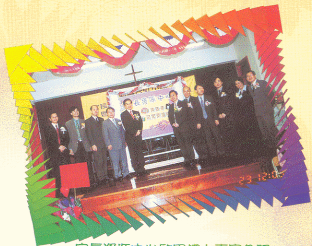
家長資源中心啟用禮上嘉賓合照