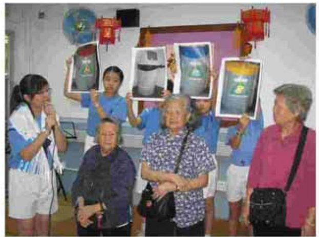
本校同學將環保訊息帶給長者