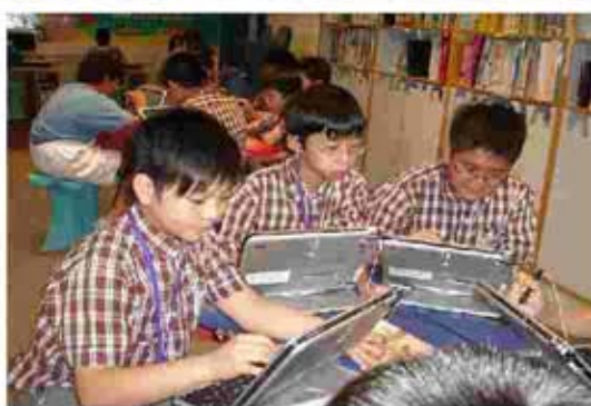
同學向嘉賓介紹如何利用 KC 平台與天津同學交流環保心得