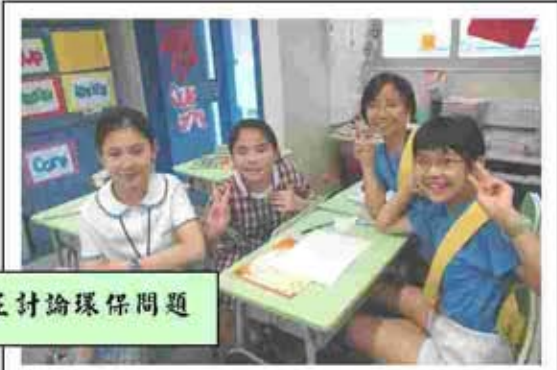
同學們正討論環保問題