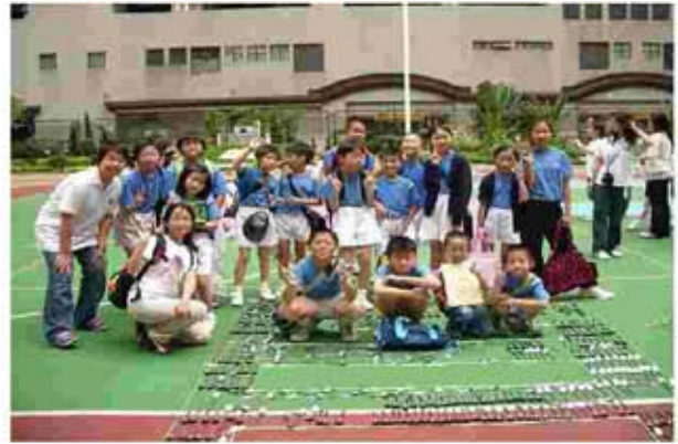
擊退即棄餐具大行動