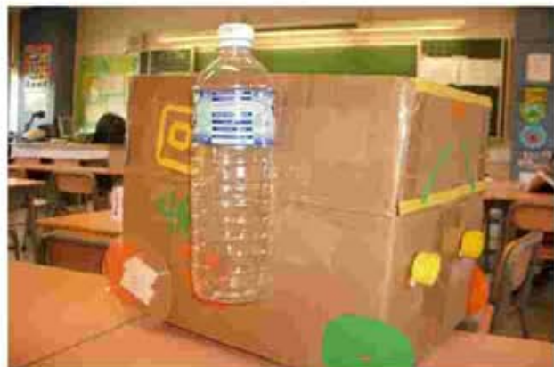
班際膠樽鋁罐回收箱設計比賽