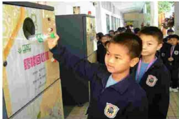
綠色力量舉辦之廢物回收機校園試驗計劃