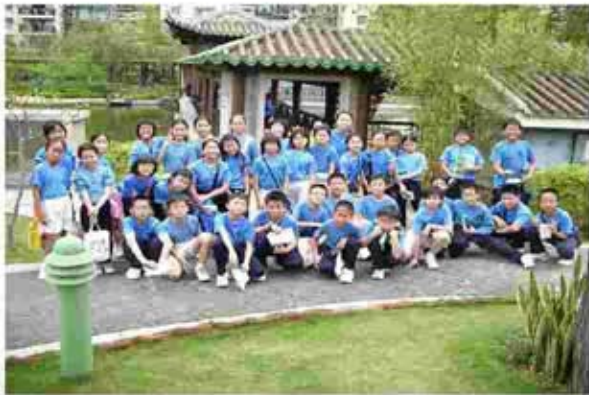
參觀“嶺南之風”公園