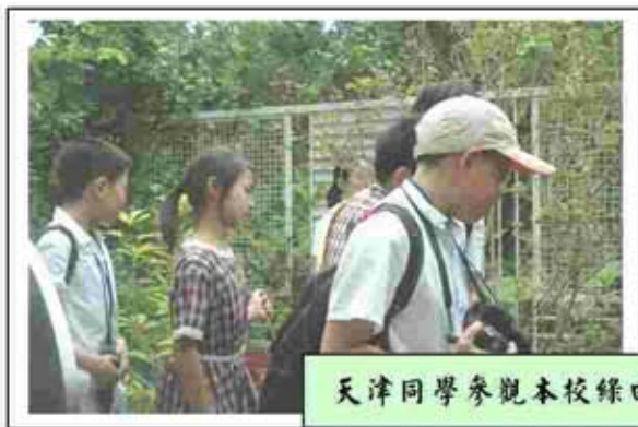
天津同學參觀本校綠田園