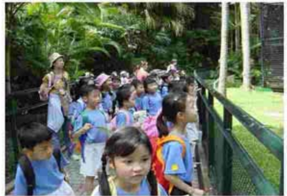
參觀香港動植物公園