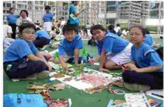
生命樹拼貼畫比賽