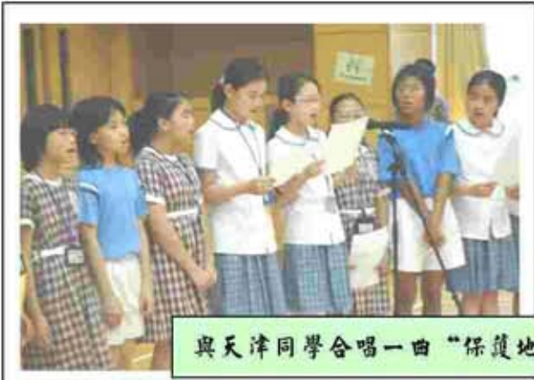
與天津同學合唱一曲“保護地球”