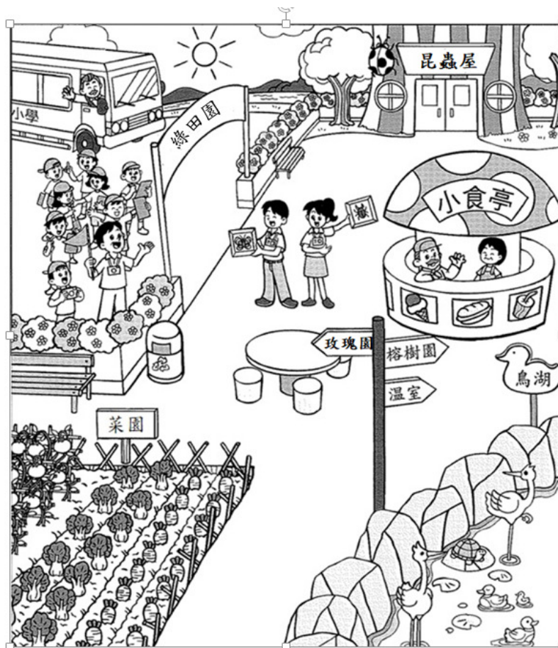
2008 P. 3 TSA寫作圖片

題目：請寫一篇記敘文，記述一次你和同學到 綠田園 的情形和感受。 (建議使用比喻或擬人法)