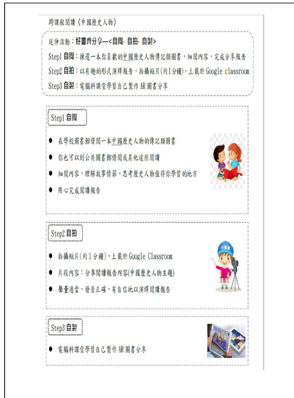
圖三：好書齊分享「自閱·自拍·自製」進行流程簡介