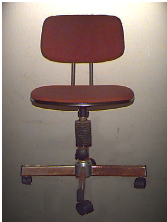
這張椅子是一左右對稱的形體。

對稱均衡必須有一中間點或線。倘若其上與下、左與右的形象相等，這便是對稱均衡。如人體、動物、昆蟲、是左右對稱的例子。而景物與其水中的倒影是上下對稱。此外，放射均衡