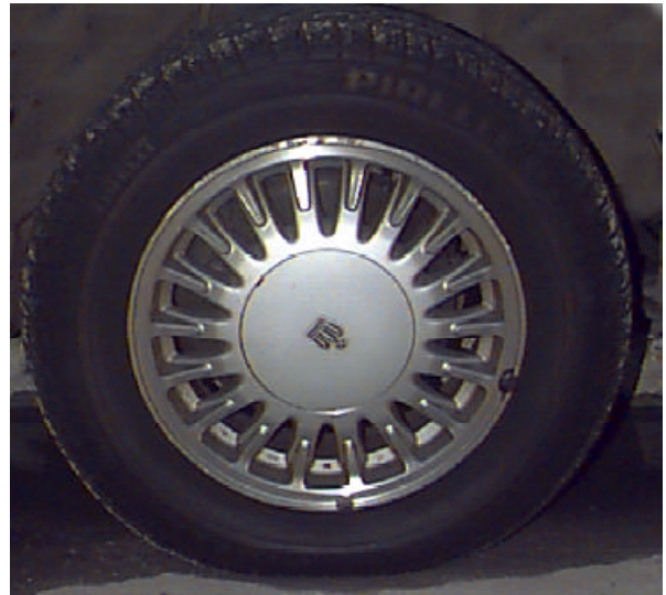
車輪內的線條與形狀構成放射均衡的形式。

所謂不對稱均衡是指中心點或線的左右上下呈現不對稱現象，然仍有自然或穩定的感覺，這種感覺是藉改變形狀的大小、色彩的濃淡及它們與中心的距離而產生的。