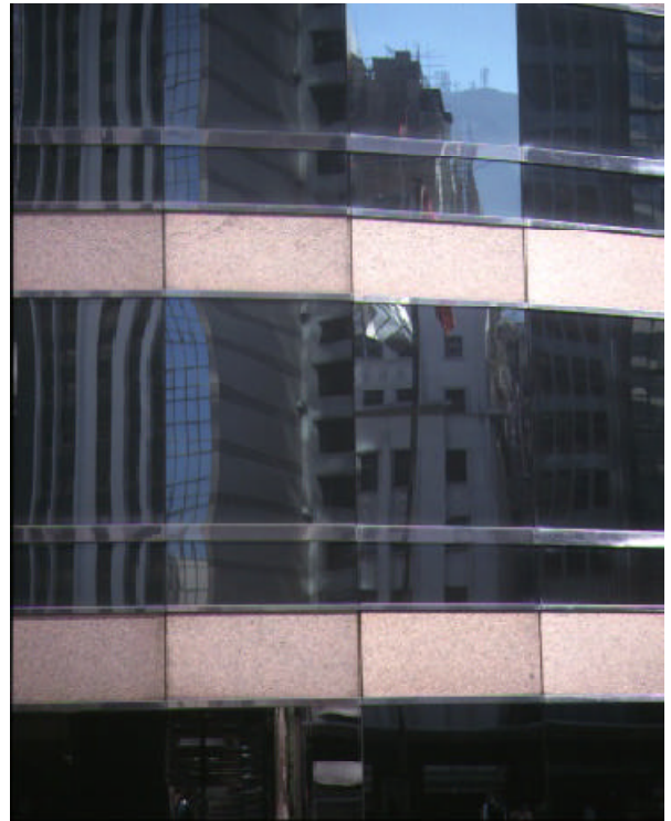
交易廣場用上石、玻璃及金屬作外牆，這些不同的物料給你甚麼感覺？

視覺質感可分為模擬質感與創作質感兩類。模擬質感是利用線條組織、明暗表現，模擬出實物的質感效果，造成視覺上的假象。創作質感同樣利用視覺元素的組織，構成不同痕跡，加強美術品本身的內容。