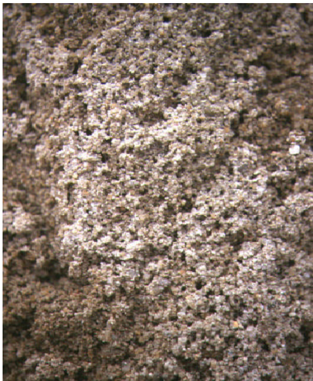
你可否憑視覺而感到沙堆是粗糙的？